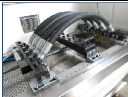
Camera di test con tubi in configurazione di prova